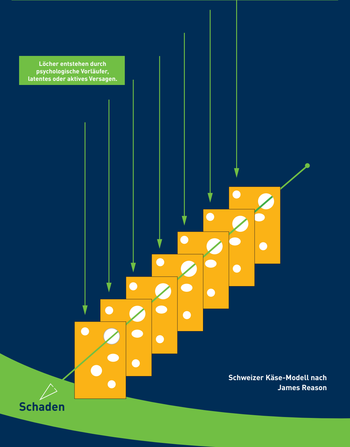
Schweizer Käse-Modell nach James Reason

Löcher entstehen durch psychologische Vorläufer, latentes oder aktives Versagen.